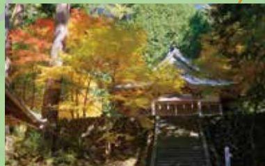
高鳥谷神社 (本堂は市指定文化財)