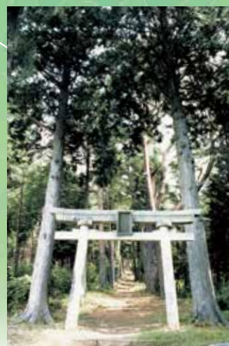
高鳥谷神社社叢 (社叢は県天然記念物)