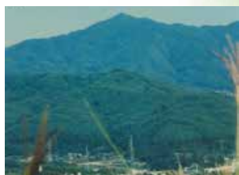
ふもとから見る高鳥谷山